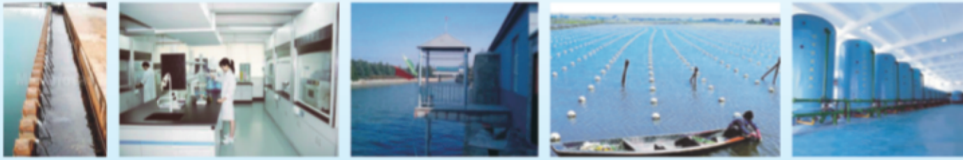
水厂 疾控中心或检测中心 江河湖海在线监测 生态养殖 海水淡化检测